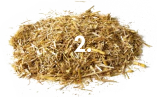
1. Flachs 2. Stroh