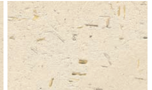
FINISH + Flachs, geglättet FINISH + Stroh, geglättet