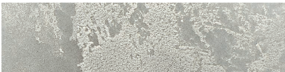
BETON-LOOK Lehmdesignspachtel 1/2 BETON-LOOK 1/2 DRY-PAINT