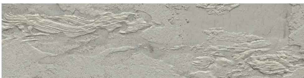
BETON-LOOK Lehmdesignspachtel Travertine