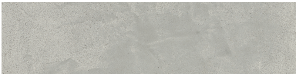
BETON-LOOK Lehmdesignspachtel geglättet