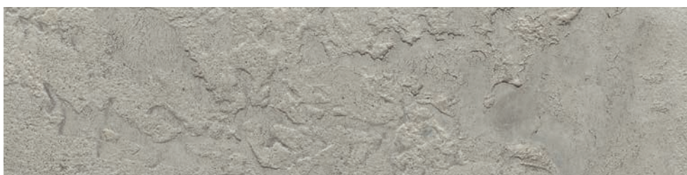
BETON-LOOK Lehmdesignspachtel Travertine + wax