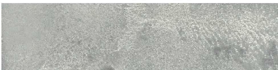
BETON-LOOK Lehmdesignspachtel 1/2 BETON-LOOK 1/2 DRY-PAINT