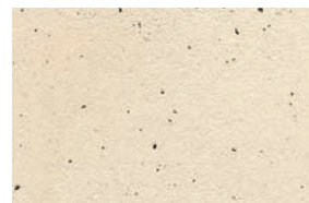
FINISH+schw. Glimmer, geglättet