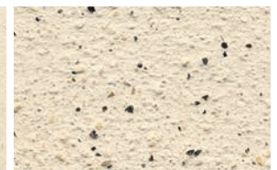
FINISH+schw. Glimmer, gefilzt