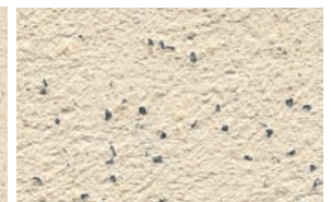
FINISH+Nero Ebano, gefilzt