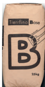
Tierrfino Base Lehmoberputz