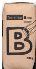
Tierrfino Base Lehmunterputz